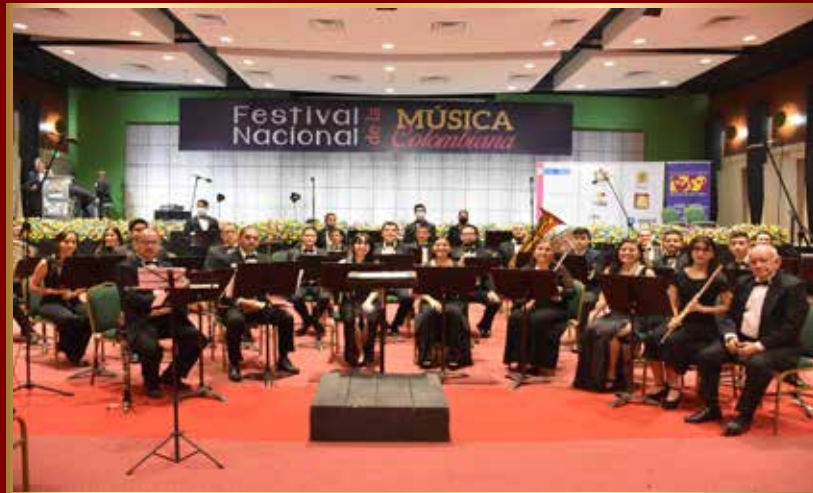
Banda Sinfónica del Tolima