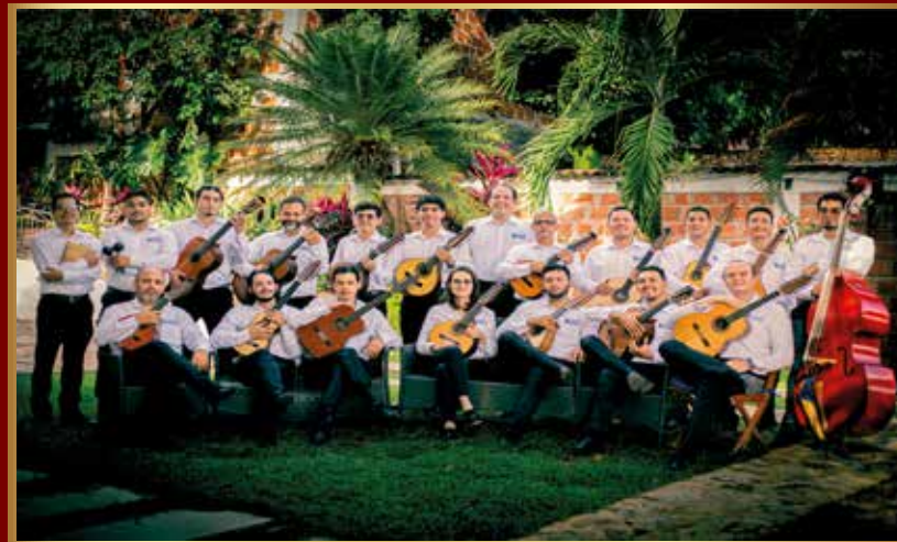
Estudiantina del Alto Magdalena