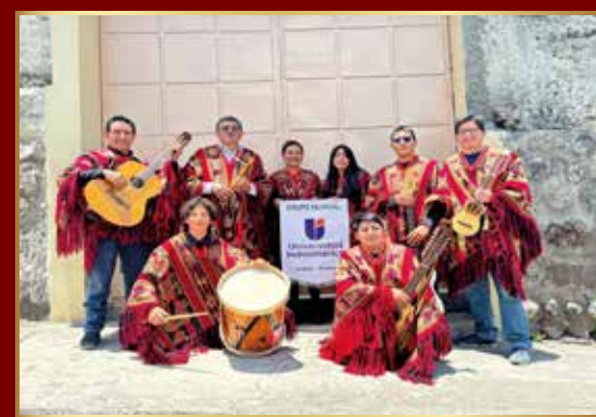
Grupo Musical Indoamérica - Ecuador